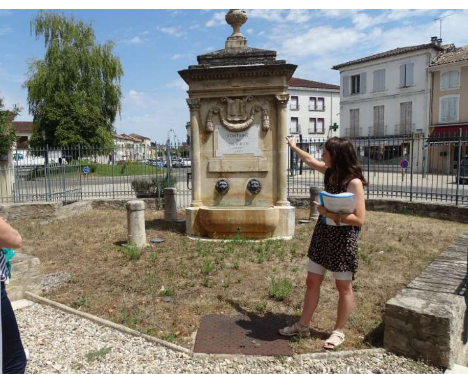
Max 25 pers - Durée 1h

Tarifs : 3,50€/pers - 3€/pers à partir de 20 pers Possibilité de coupler deux visites