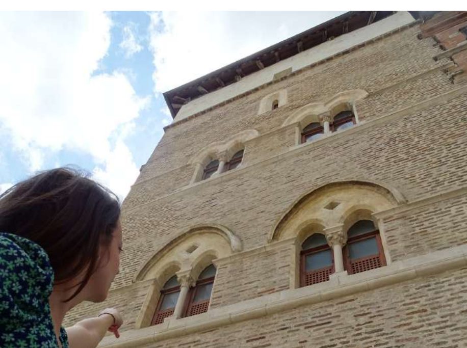
Place Notre Dame - CAUSSADE Max 20 pers - Durée 1h

Tarifs : 3,50€/pers - 3€/pers à partir de 20 pers Possibilité de coupler deux visites