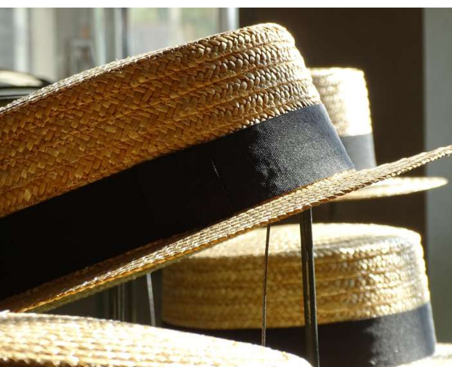
Max 25 pers - Durée 1h